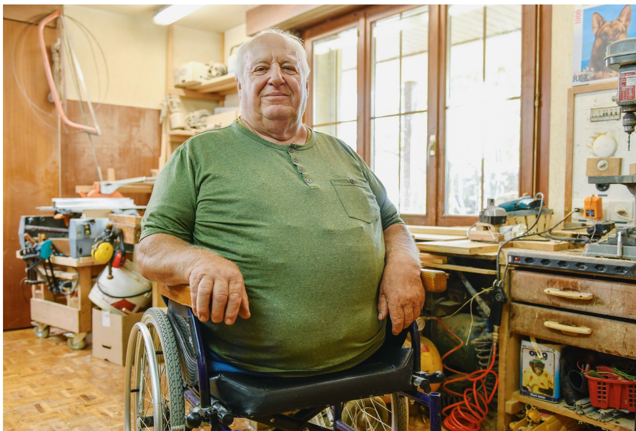
In seiner Werkstatt verbringt er viele Stunden und stellt dabei alle möglichen Objekte her: Spielzeug für seine Enkelkinder, Untersetzer, Stühle und vieles andere.