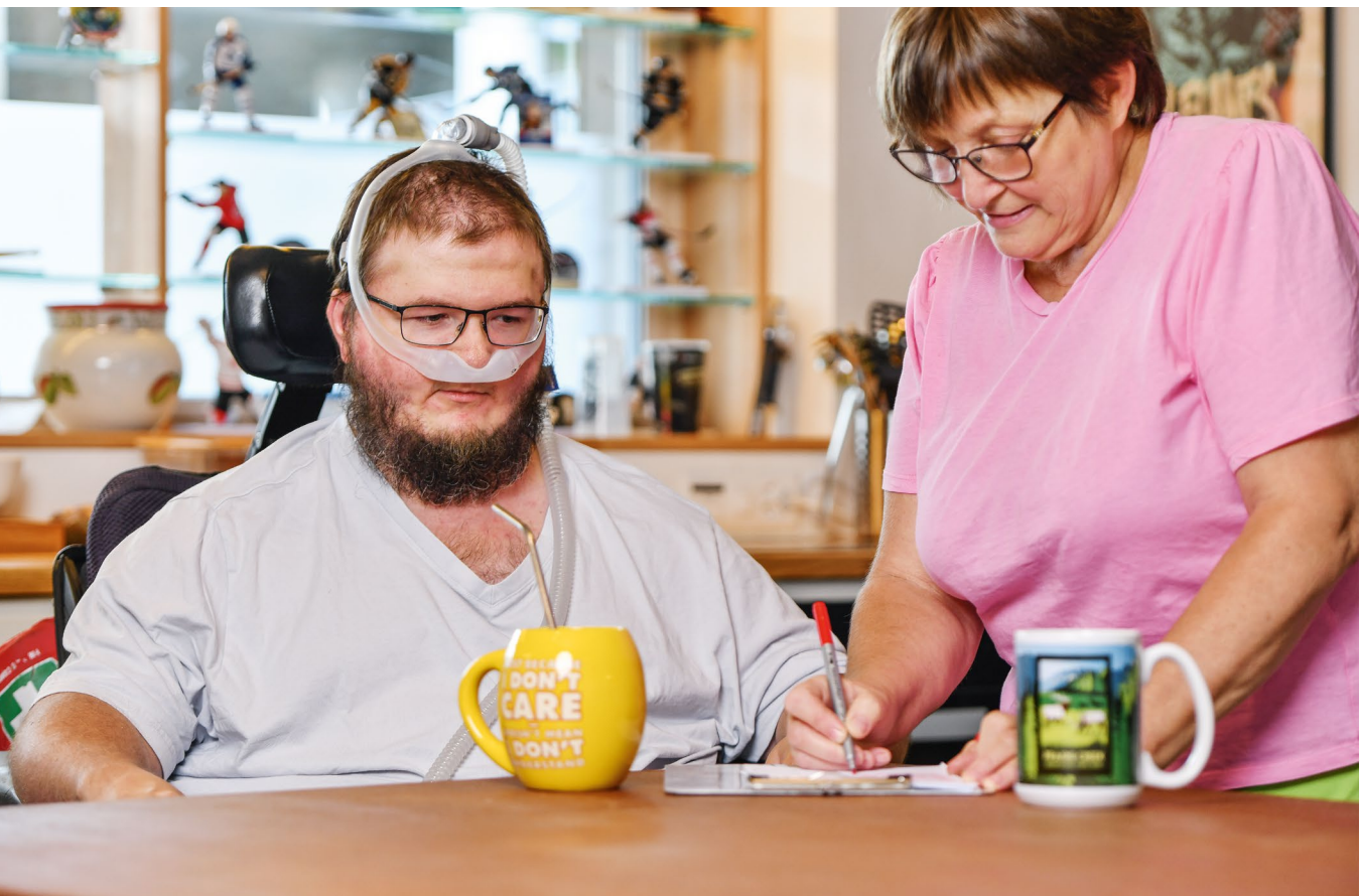
Gehört auch zum Alltag: Mahlzeiten planen und Einkaufslisten schreiben.