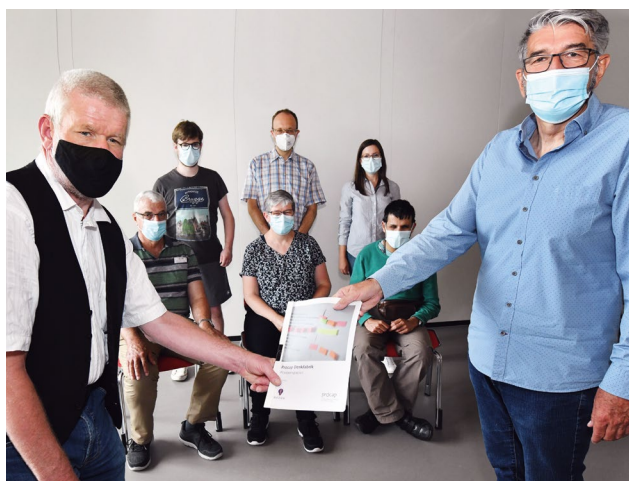
Höhepunkt von einem Jahr Arbeit: Übergabe des Positionspapiers an die Geschäftsleitung von Procap Schweiz.

Es war ein umfassendes Positionspapier, welches eine Delegation der Denkfabrik Ende Juni an die Geschäftsleitung von Procap Schweiz übergeben konnte. In 8 Schwerpunkten mit insgesamt 39 Forderungen geht es um ein gemeinsames Ziel: die Gleichstellung von Menschen mit Behinderungen in allen Lebensbereichen.