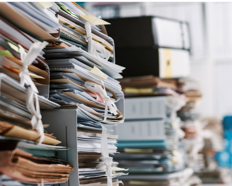
Arbeitsverträge, Lohnzahlungen und Einsatzpläne: Die Organisation ihrer Assistenzpersonen übernehmen die Betroffenen selbst.

Aus diesen Gründen ist für viele Menschen mit schweren Behinderungen ein selbstbestimmtes Leben in der Form, wie es in der UNO-Behindertenrechtskonvention definiert wurde, kaum erreichbar. Trotzdem haben in den vergangenen Jahren immer mehr Personen mit unterschiedlichen Handicaps den Schritt in ein selbstbestimmtes Leben gewagt.