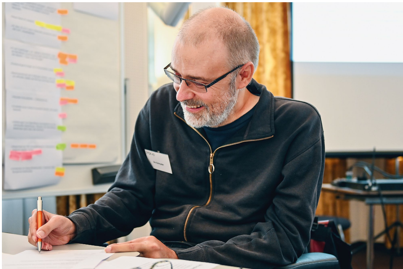
Mitreden, mitgestalten und sich einbringen: Die Procap Denkfabrik hat allen Teilnehmenden sichtlich Spass gemacht.

Das Positionspapier und weitere Informationen finden Sie unter: www.procap.ch/denkfabrik